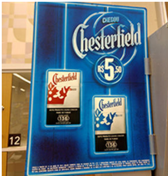
Supermercado em Maringá, PR